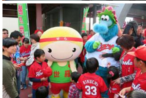
世羅町の市町村PR隊の様子

基づいて、スイーツ・タコ・地酒を重点3品目に設定し、2700万円の予算を計上しているが、その一環としても市町村PR隊を実施してはどうか。