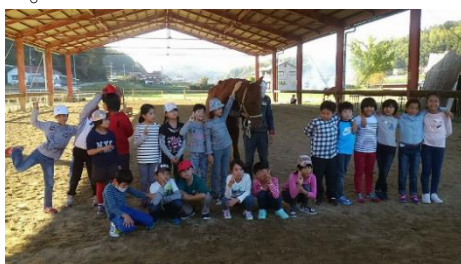
苜谷乗馬クラブでの体験活動の様子

児童 1 人あたり 5 千円から 1 万円も増加すると試算されている保護者負担を軽減することになるだけでなく、ご寄附いただいた方のご意志や市長の施政方針にも合致すると思ひがどうか。