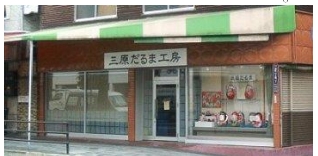
三原だるま工房 (三原だるま工房HPより)

市からは、駅周辺での体験観光を促進するため、だるま工房の管理運営者である観光協会に補助金を出している。だるま工房は、平成11年度に策定した中